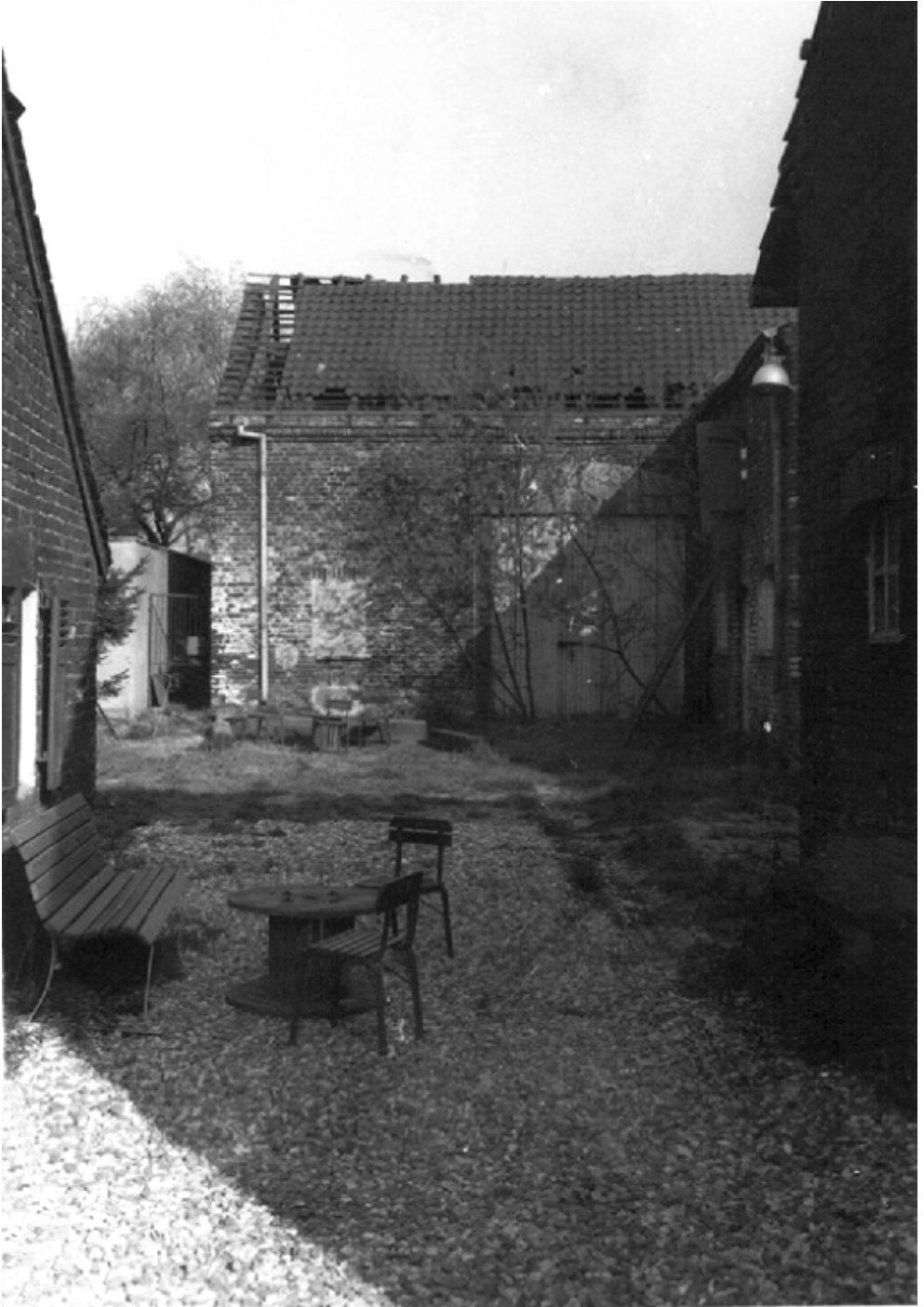
Abb. 1: Blick durch das Tor auf die später abgerissene Hinterhofscheune (1984)