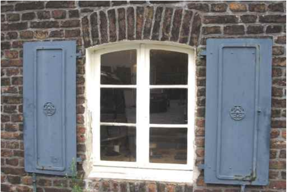
Abb. 8: Restaurierte Metallfensterläden an der Straßenseite