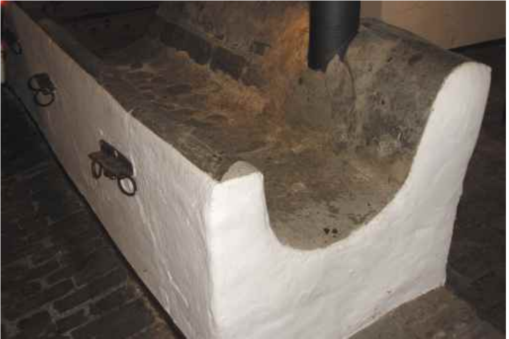
Abb. 6: Futterrinne mit Halteringen im ehemaligen Kuhstall