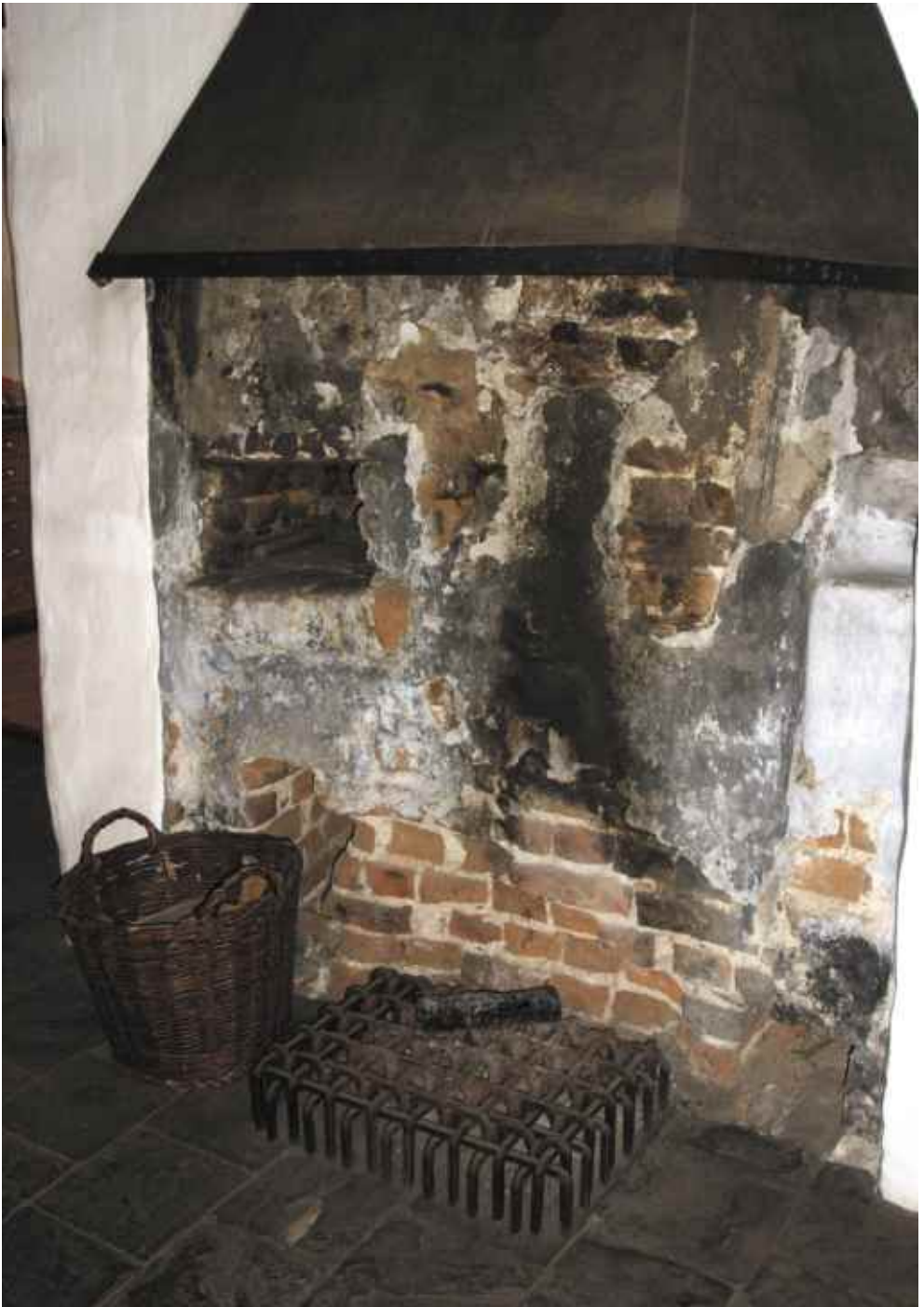
Abb. 5: Historische Feuerstelle mit Backnische von 1650; davor Sandsteinplattenboden