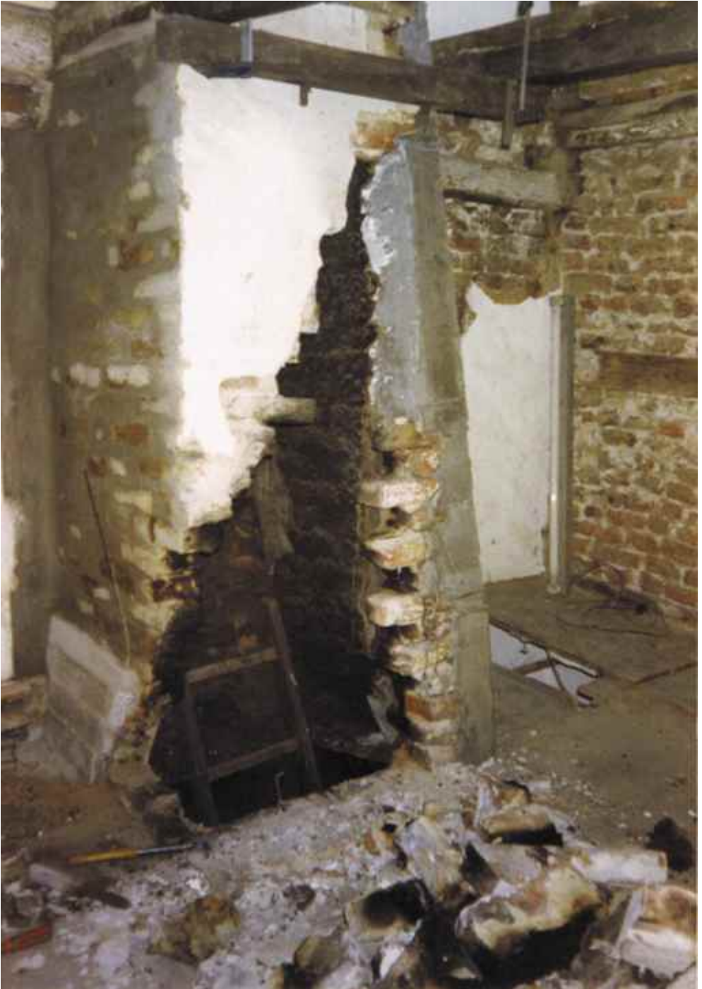
Abb. 3: Kamin-Renovierung 1984