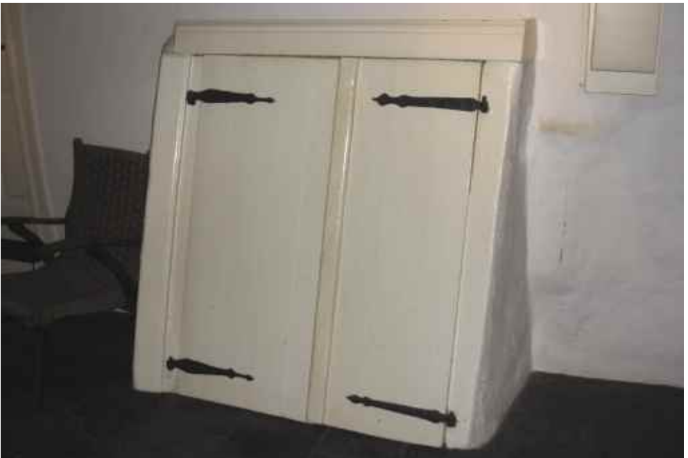
Abb. 7: Gewölbekellerzugang mit handgeschmiedeten Beschlägen