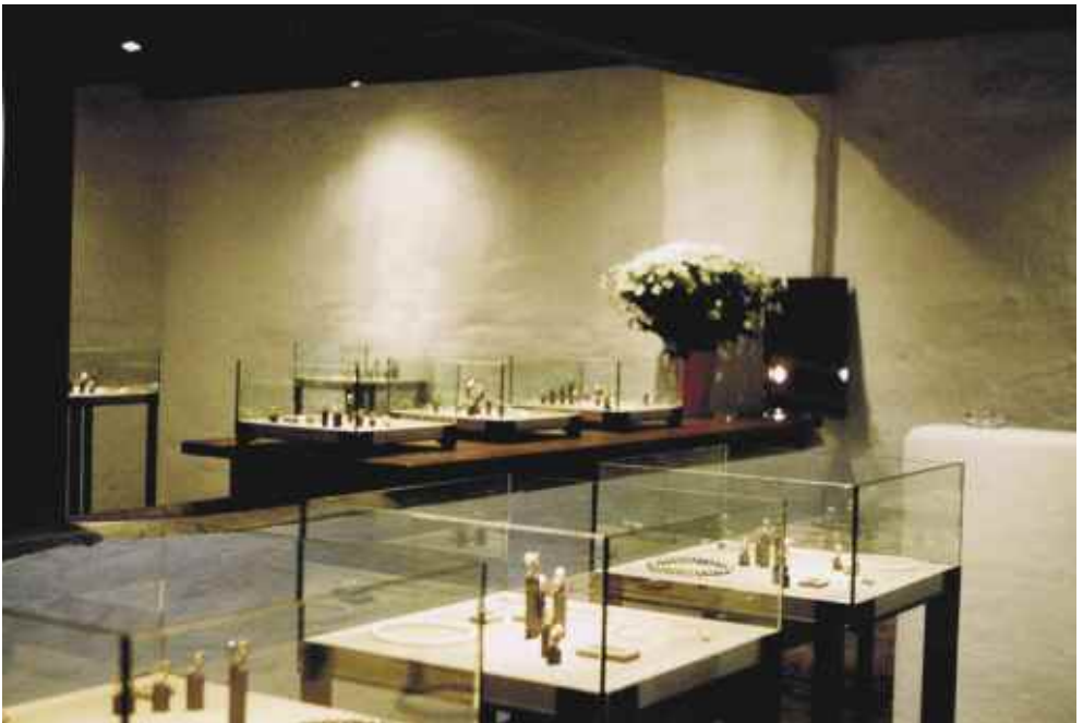
Abb. 9: Schmuckausstellung im Kuhstall