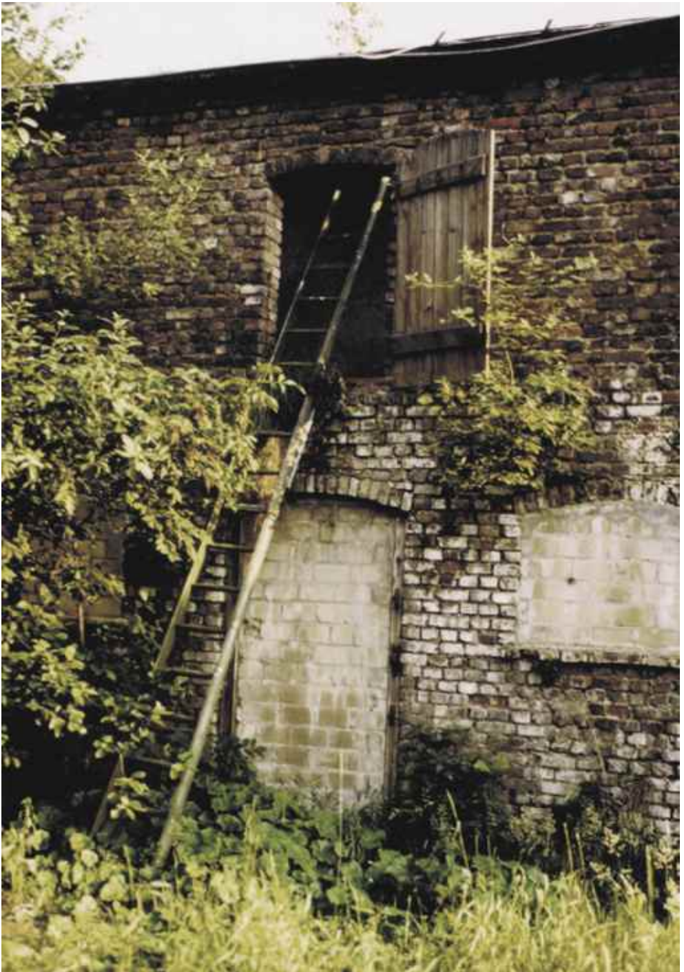
Abb. 2: Später abgerissener Schweinestall zwischen Kuhstall und Scheune (1984)